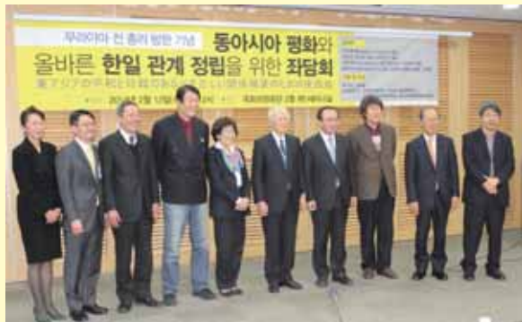
韓国有識者との座談会にて記念撮影=2月12日、ソウル市内

韓国の与野党国会議員らと「村山談話」の今日的意義や日韓交流の大切さを論じ合い、従軍慰安婦